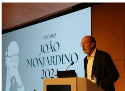
Sessões dos prémios em 2025

Durante o ano de 2025 foi levada à prática uma iniciativa há muito planeada: a exposição do quadro A Leitura em espaços públicos devidamente selecionados. A primeira oportunidade surgiu com as celebrações dos 50 anos do Hospital Pulido Valente no mês de junho e a segunda, em outubro no âmbito do bicentenário da Faculdade de Medicina de Lisboa.